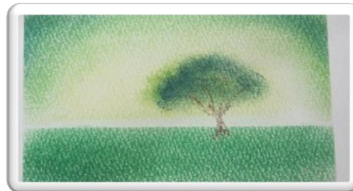
パステル和アート

胃の半分をとってから1年 経つけど、なかなか物が食べれ ないんだよな。体重は13キロ 減ったまま。経験者でも、それ ぞれ言うこと違って好き勝手な こというんだよ・・・