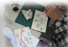
パステルアート 作成風景