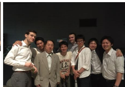
← ↑ 昨年の病院説明会の様子